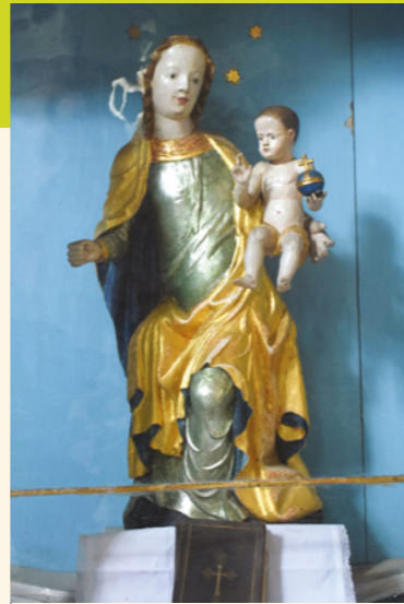
A kép nem adja vissza azt a kisugárzást, melyet a Madonna-szobor áraszt

Templomunkban a jobb oldali oltár üvegszekrényében látható a gótikus, fából faragott Madonna-szobor. Ahányszor csak a templomban vagyok, mindig úgy helyezkedem el, hogy láthassam. Van valami különleges erő, ami hozzá vonz. Talán az a tekintet, amiről azt gondolom, mindig rám néz, és az égi mosoly, ami fohászadásra, beszélgetésre hív.