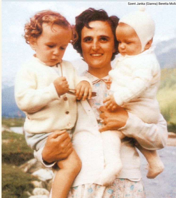
Szent Janka (Gianna) Beretta Molla