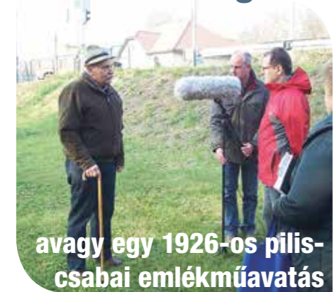
avagy egy 1926-os piliscsabi emlékműavatás