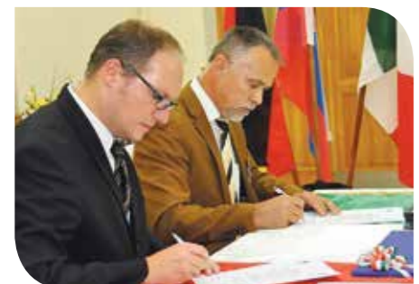
Aklihegyre, ahol dr. Oroszi József polgármesterrel aláírtuk a szándéknyilatkozatot, amit az

A szomszédos Ukrajnában több mint egy éve háború dúl. Kárpátalján kétszáz ezer magyar honfitársunk él, sokan közülük mindennapos megélhetési gondokkal küzdenek. Ilyen helyzetben a lelki, a szimbolikus támogatás is segítséget jelenthet számukra, ezért kezdeményeztem, a Nevetlenfaluhoz tartozó Aklihegy településsel testvértelepülési megállapodást kötöttünk. Aklihegygel a Páduai Szent Antal Gimnázium már 15 éve ápol szoros kapcsolatot, 2000-tól szervezi meg ugyanis az iskola minden évben a Kárpát-medencei iskolák találkozóját. Júniusban utaztam először