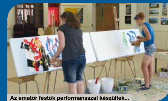
Az amatőr festők performansszal készültek...