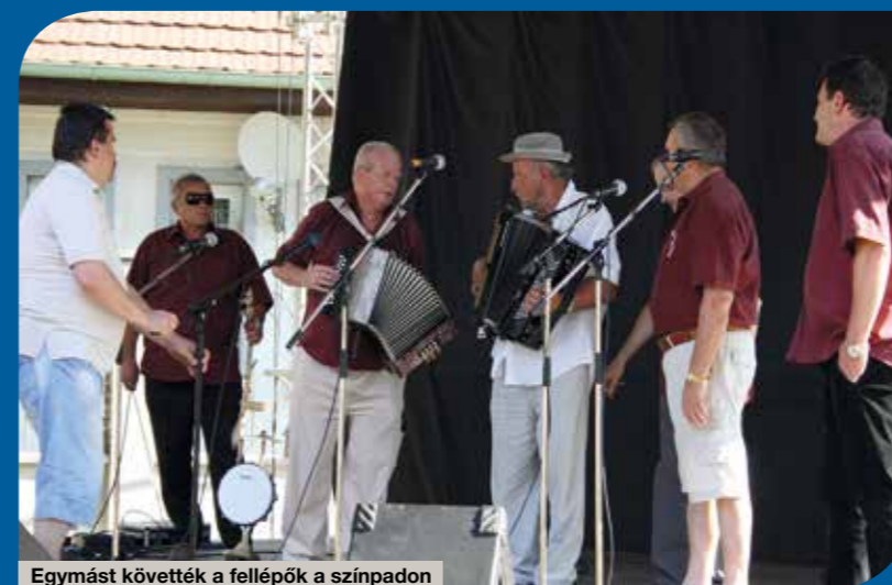
Egymást követték a fellépők a színpadon