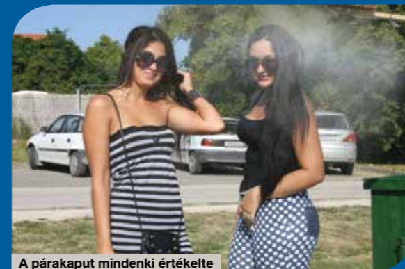
A párapaput mindenki értékelte