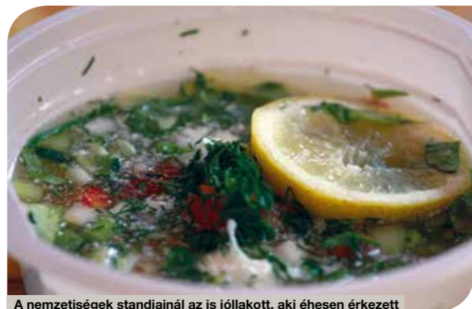
A nemzetiségek standjainál az is jóllakott, aki éhesen érkezett