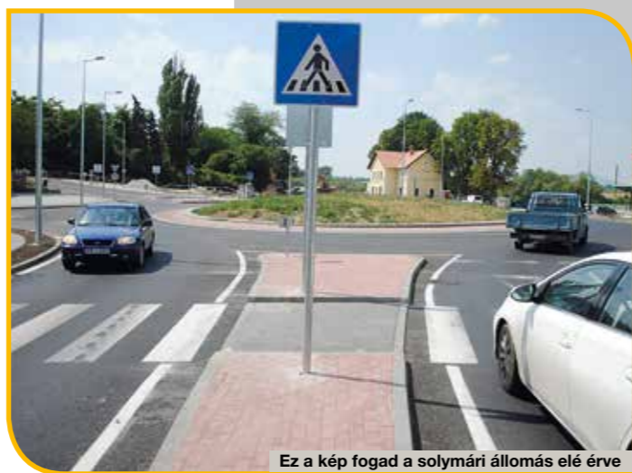
Ez a kép fogad a solymári állomás elé érve