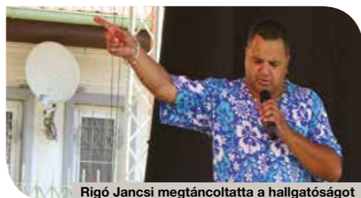
Rigó Jancsi megtáncoltatta a hallgatóságot