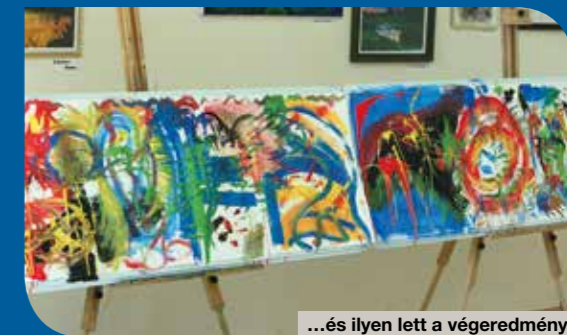
...és ilyen lett a végeredmény