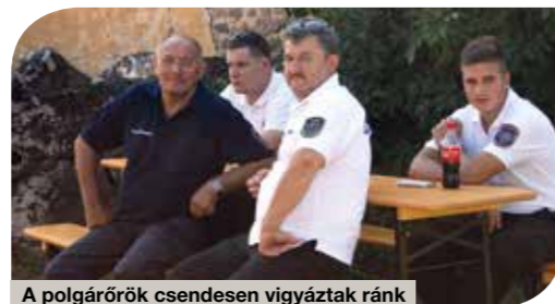
A polgárok csendesen vigyáztak ránk