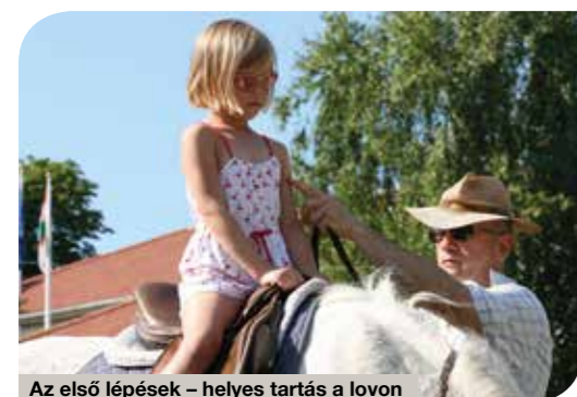
Az első lépések – helyes tartás a lovon