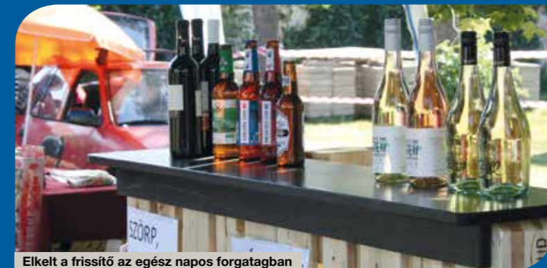
Elkelt a frissítő az egész napos forgatagban