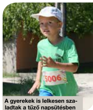
A gyerekek is lelkesen szaladtak a tűző napsütésben