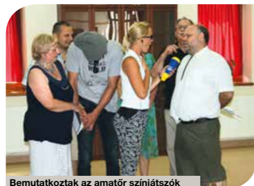
Bemutakoztak az amatőr színjátszók