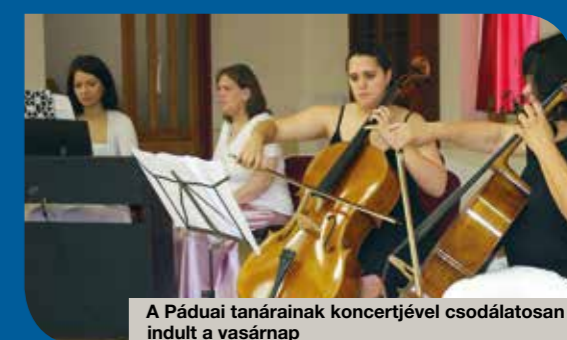
A Pádai tanárainak koncertjével csodálatosan indult a vasárnap