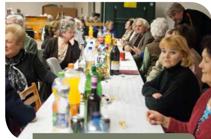
Résztevők egy márciusi Pobocskán

Az elnök azonban nem csak a magukat szlováknak vallókat szeretné bevonni a Pobocska vagy a nemzetiségi önkormányzat programjaiba, hanem a városlakókat is. Amennyiben megvalósul a nyelvi képzés, akkor ott tárt kapukkal várják majd a szlovák iránt érdeklődőket, szimpatizánsokat is, ahogy a rendezvényeken is szívesen látnak más nemzetiséghez tartozókat.