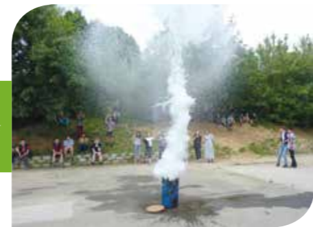
Egy sikeres fizikai kísérlet az udvaron

A sok esemény és eredmény mellett a legfontosabbnak továbbra is azt tartjuk, hogy diákjaink emberségükben, hitükben fejlődjenek. Ezt számos lelki program, közös imádság, szociális munka segítette. Nagy örömmel, hogy a gyermekek nevelésében a szülők is mellettünk állnak, sőt az idősebb diákok is aktívan részt vesznek a kisebbek vezetésében, például cserkész- vagy regnumvezetőként.