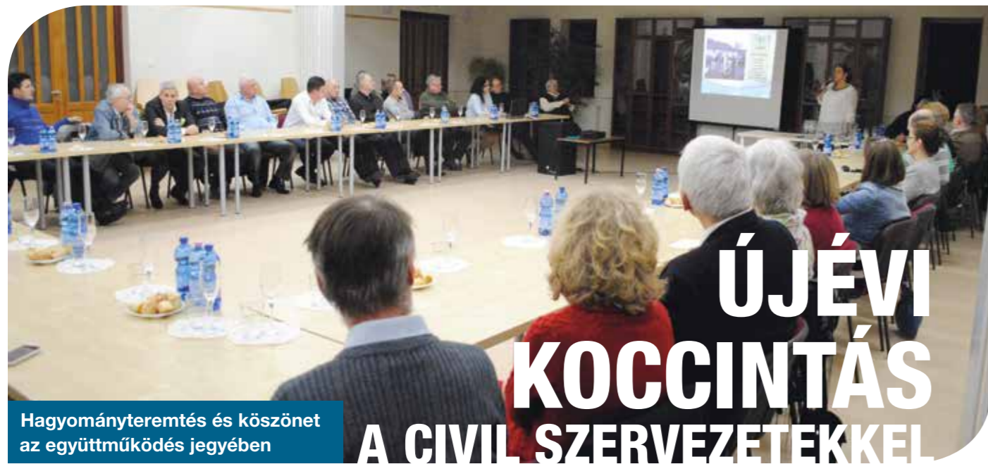
Hagyományteremtés és köszönet az együttműködés jegyében