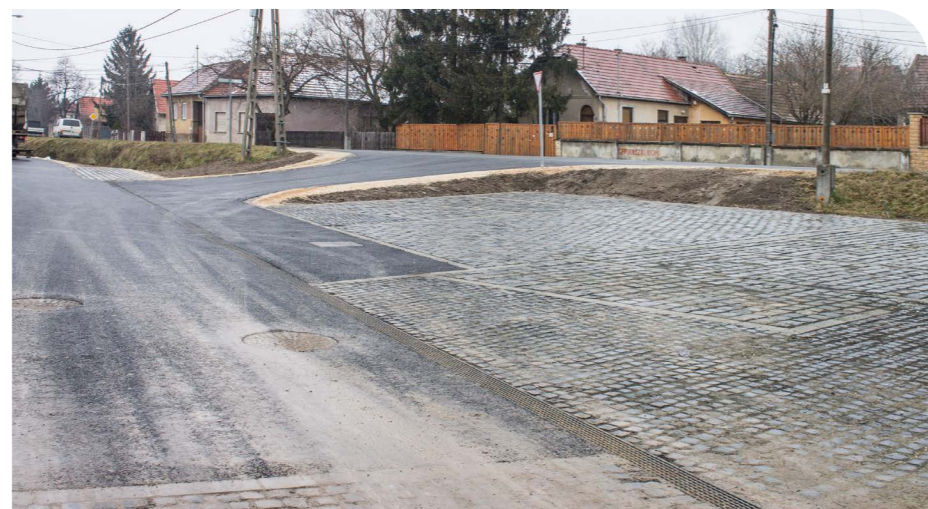
Idő előtt elkészült az Iskola utca és a 10-es út találkozásánál lévő tér felújítása a Magyar Közút beruházásában. A munkálatok egyben a terület vízelvezetéséről is gondoskodnak.