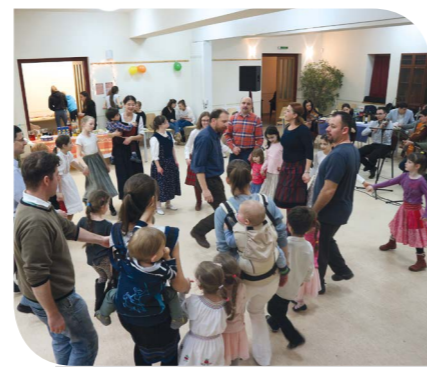
Farsangi tánc és hangszerkészítés a Piliscsabai Táncművelési Egyesület szervezésében

céllal indította el a bogas.klubot a HK-ban (Fényesliget Kávézó), hogy legyen egy alkalom, egy hely a faluban, ahol népzene mellett van mód beszélgetni, ejtőzni, simulni a heti „gyötörtésből”. És miután az első este jól sikerült, arra gondoltak, folytatják.