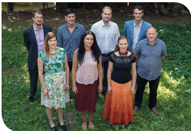
A CD-n közreműködő zenészek és énekesek

A klasszikus diplomámmal elkezdtem népzene-t tanítani, nem is akartam más stílust. A fiam kérdezte meg, hogy miért nem végzem el népzene szakon is a Zeneakadémiát. Először nem is gondoltam erre, de kiderült, hogy felnőtt-