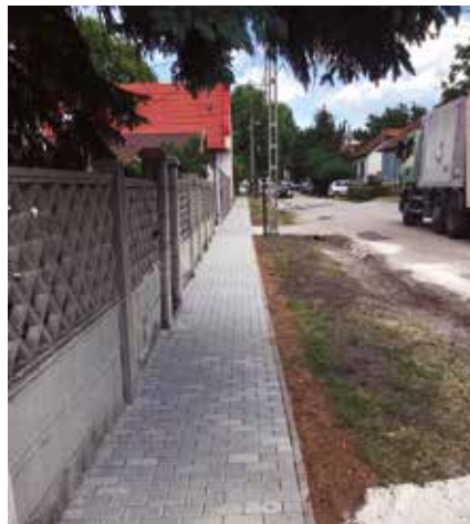
...és az Új utcában

Tavasszal megtörtént a szokásos évi kátyúzás is, az útjavítási munkálatokra az önkormányzat idén tavasszal 800 ezer forintot költött. Az Új utcába pedig forgalomlassító küszöböt telepítettek.