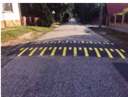
Az Új utcai fekvőrendőr sárga csikkokkal

Tavasszal megtörtént a szokásos évi kátyúzás is, az útjavítási munkálatokra az önkormányzat idén tavasszal 800 ezer forintot költött. Az Új utcába pedig forgalomlassító küszöböt telepítettek.