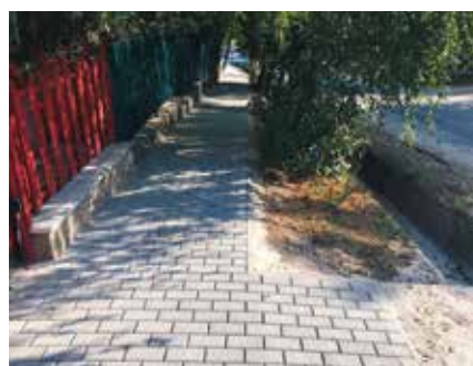
A Máriapark utca új járdája