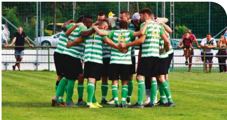
Youla a PSE csapatában

Még egy török-belga-francia első osztályú „körút” telt el, amikor szóba került a Kispest Honvéd mint lehetőség. Magyarországról nem sokat tudott, ezért ideutazott egy háromnapos tesztre, ami annyira jól sikerült, hogy a gólok mellett egy szép magyar leányt is szerzett magának feleségül. A kispesti évek után – már családostul – beleköltött az amerikai bajnokságba (Indy Eleven), és noha még játszott két szezont Belgiumban, amit tévesen levezetésnek gondolt, letelepedni Magyarországra tértek haza, meghozta Piliscsabára.