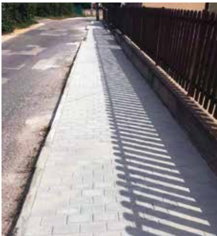
Új járda a Hársfa utcában...

A nyár folyamán településünkön három utcában is épült járda. A Hársfa, a Máriapark és az Új utcában is pályázati forrásból épültek meg a járdák. A beruházás 18 292 724 forintba került, a munkálatokat június és augusztus között végezték el.