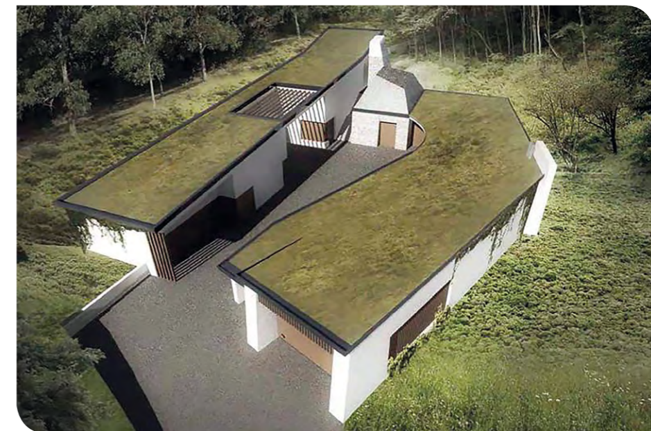
A Iosephinum terület központi energiaépülete

A napenergia-hasznosítás mind napelemek, mind napkollektorok alkalmazásával lehetséges, az elhelyezhető napkollektorok méretét és mennyiségét a tetőfelületek erre a célra való felhasználhatósága határozza meg egyik oldalról, másik oldalról a létesítmény nyári alaphőigényének biztosítása javasolt a napenergia felhasználásával. Az előzetesen kalkulálható teljesítményigény 100-150 kW,