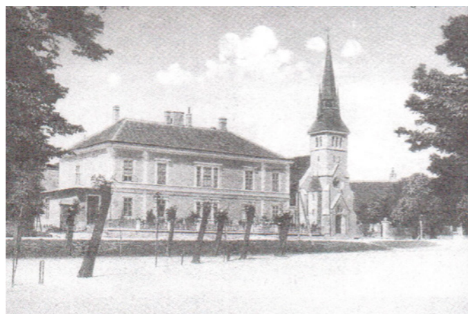
A kistemplom a lazarista rendházzal

A századforduló után tovább folyt az építkezések. 1903-ban Budapesten, a Gát utcában épült rendház, majd 1910-ben a Ménesi úton.