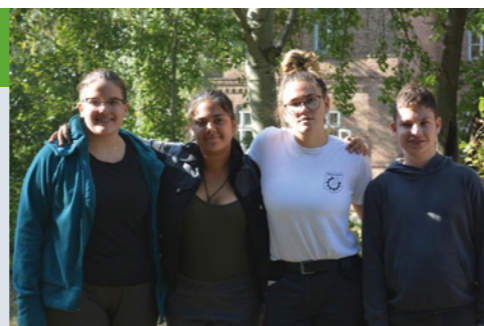
Vérgző Varangyok (a 9. B osztály csapata)

KMASZC Dr. Szepesi László Mezőgazdasági Technikum, Szakképző Iskola és Kollégium