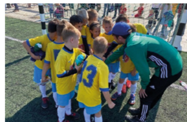
U7-es és U9-es csapat