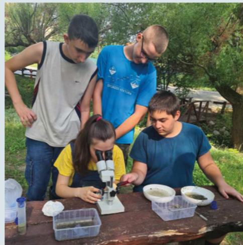
Levelibékák (a 10. B osztály csapata)