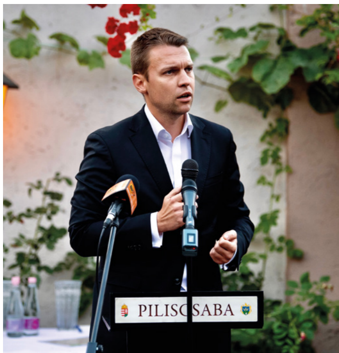
Menczer Tamás államtitkár a PNKE 30. jubileumi ünnepségén

Minket, akik itt élünk Piliscsabán, sokszor lekötnek mindennapi ügyes-bajos dolgaink. Pedig milyen hasznos néha olyasvalakivel is beszélni, aki más szemszögből látja a jelenünket és a lehetőségeinket. Erre teszünk most kísérletet.