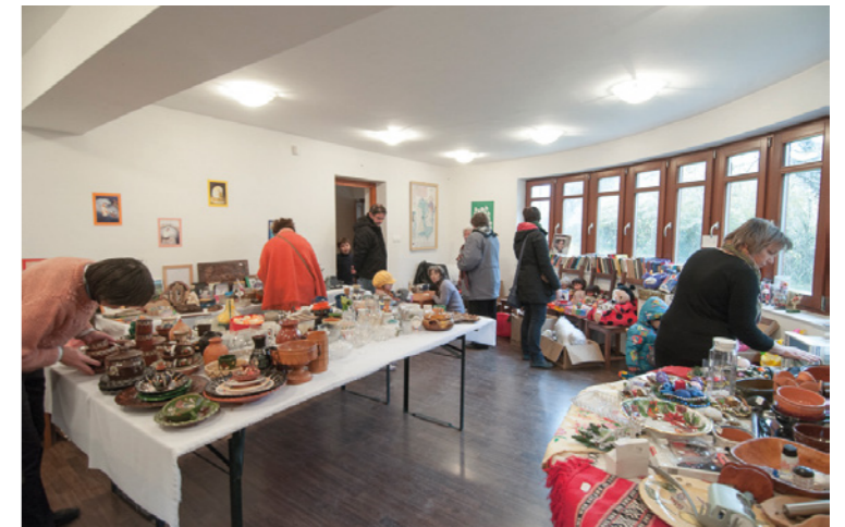
Erzsébet-napi vásár