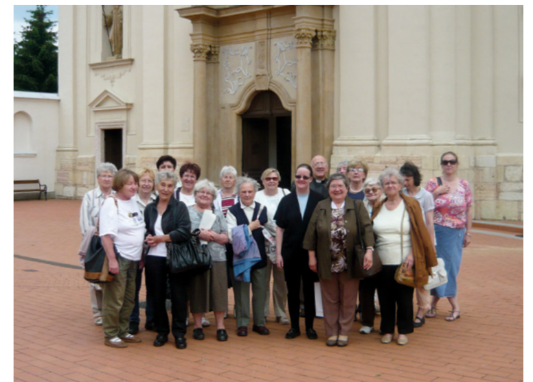
Csoportkép a 20 éves évfordulón