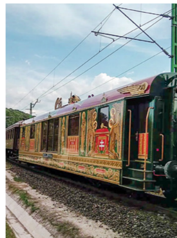
Az Aranyvonat 2021-ben, ahogy áthalad Piliscsabán (Foto: Laczik Tomaj)

Forrás: Katona István: A Szeretet köteléke