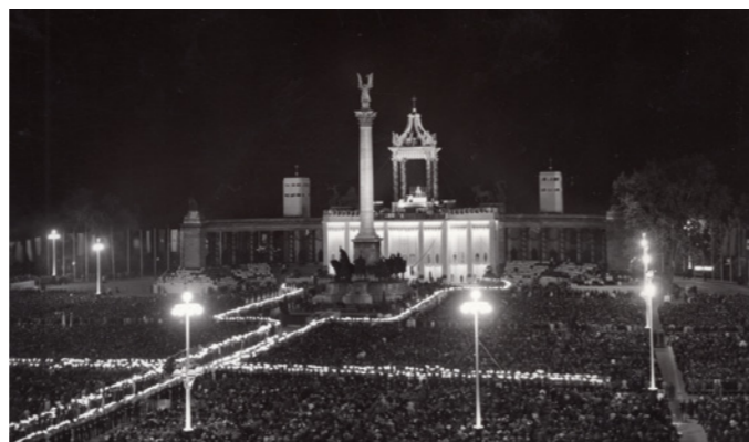
Hősök tere, Eucharisztikus Világtörvényszabás 1938

két-két luxuskocsi fogta közre, ezekben utaztak az egyházi és világi méltóságok.