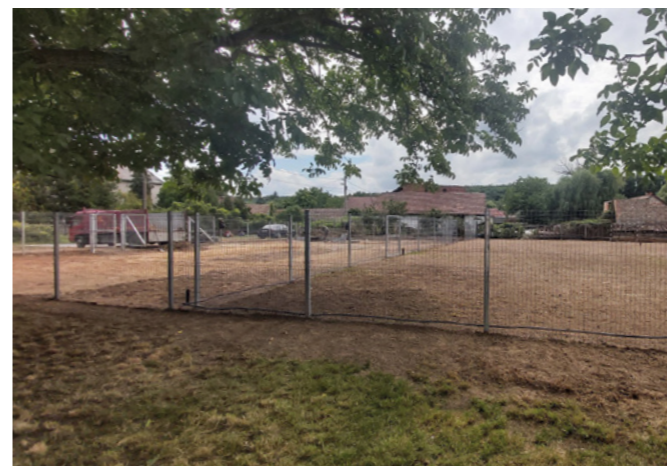
Játszóter az Új utca és Kálvária utca sarkán

A játszótéren mérleghintát, mókuskereket, labirintusjátékot, csúszdát, hintát és babahintát, valamint álló-forgó játékokat telepítünk, illetve a terület parkosítása történik majd meg.