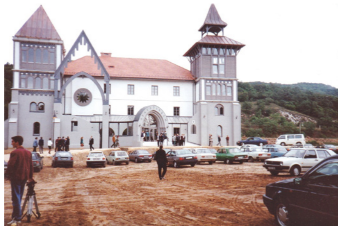
Az első tanévnyitón (1994)

parkkal és sétányokkal már egészen más képét mutatta. Több mint ezer hallgató járt az egyetemre, a hatalmas, karszalagos nagyrendezvények rendszereket voltak, és még az épületekben külön-külön álló, de nagyon jól használható könyvtárak is a rendelkezésünkre álltak.