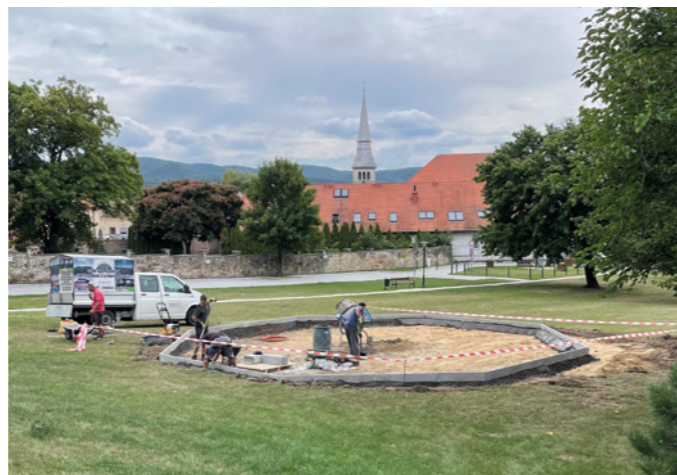
Fitneszpark a Csaba-kertben

Ezzel a beruházással és a templomtorony felújításával látványossá válik a településközpont fejlesztésének folytatása. Július közepén