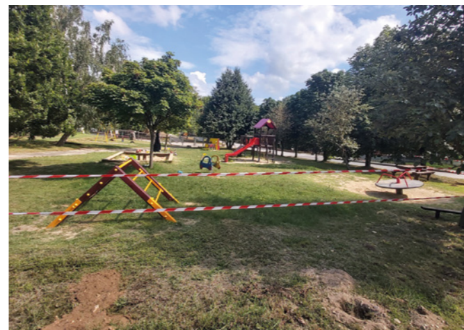
Benedek Elek játszótér

Az 1977-ben létesült, akkoriban Barátság Parknak nevezett terület a 2000-es évek elején kapta a Benedek Elek Park elnevezést, ám az évek során folyamatos felújításra szorult. Ennek a helyzetnek azonban pár héten belül vége, hiszen a játszótérre új játékok kerülnek, többek között láncos egyensúlyozó, mókuskerek, függeszkező-forgó,