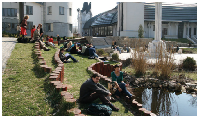
Az Anselmianum előtt (2009)

2001-ben édesanyám már nagyon beteg, de még utójára kilátogatott Piliscsabára és az egyetemre, a diplomaosztó ünnepségre. Büszke volt rám, mosolygott, az első, 1993-as látogatásunk minden pillanatára emlékezett. „Most már nyugodtan meghalhatok, diplomás vagy, igyekezz jóra használni, és légy mindig szorgalmas, kisfiam!” – kérte édesanyám. És így is történt. A Pázmány akkor a szép új épületekkel, a rendezett