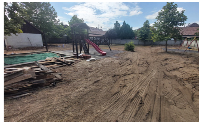
Napsugár Óvoda udvara

mászófalas torony, valamint két mozgássérülteknek kialakított játék. A játszótéren parkosítás is várható, illetve új kerítést kap a terület, hogy biztonságos és szép környezet várja a gyerekeket, várhatóan a nyár végére. A városi játszótérek mellett a Napsugár Óvoda udvara is megújul, ahová új játékok és növények telepítését tervezzük a nyár folyamán, ezzel folytatva az óvodakert-felújítási programot.