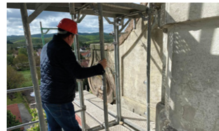
A kőből készült voluta ellenőrzése

Koós Gábor műszaki szakértő