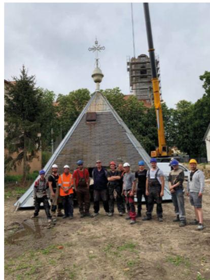
Köszönet a szakértő csapatnak!