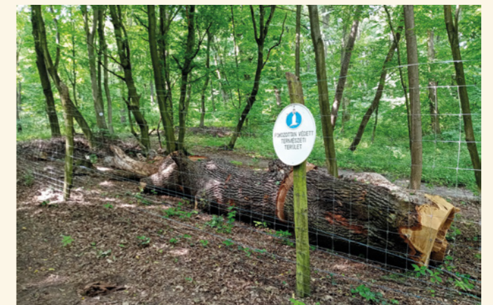
A százéves tölgyfa a Jági Tanösvényen