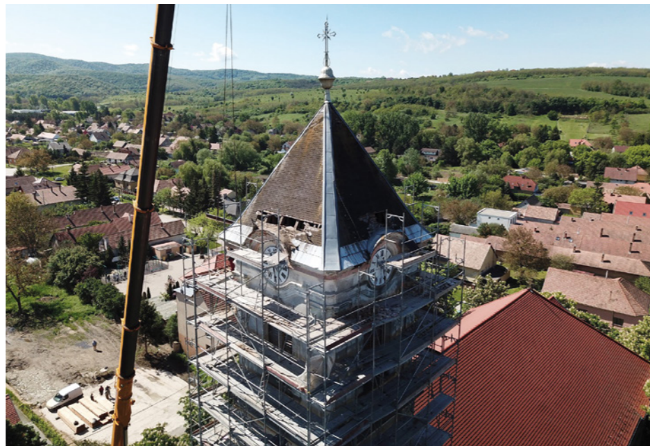
A toronysisak leemelése