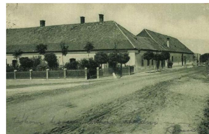
Piliscsaba utcarészlet (1945 előtt, Zempléni Múzeum, Ltsz.: 0167266)

„1746-ban a csabai kocsmában gyilkosság történt. A forrás arról is megemlékezik, hogy a kocma ekkor a budai klarisszák tulajdonában volt, így szinte biztos, hogy a máig »Klarissza-ház-ként« ismert épületről van szó, aminek már ekkor vendéglátó funkciója volt. Az épületnek tehát az első bizonyítható építési periódusa a 18. század első fele. Ebben az időben építkeztek Piliscsabán a birtokos klarisszák, akik jelentős összeget áldoztak a piliscsabai birtok kiépítésére és a plébániatemplom helyreállítására. Központi, országút menti elhelyezkedése kiválóan alkalmas volt a vendéglátó funkcióra. A telek hatalmas méretéből következik, hogy egy nagyobb gazdasági egység volt itt: a klarisszák birtokközpontja. Ez valószínűleg jól megfér a