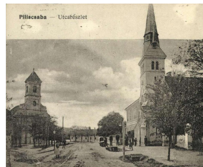
Piliscsaba utcarészlet (Zempléni Múzeum, Ltsz.: 0167266)

(Részlet a Piliscsabai Polgár 2019. júliusi számából)