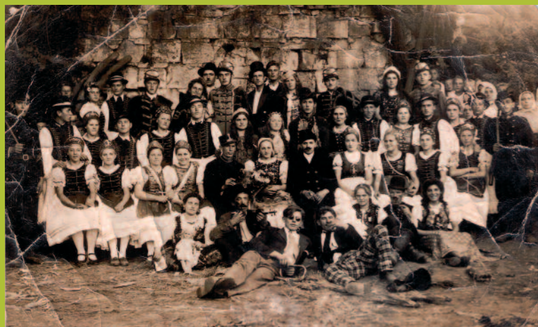
Szüreti bál 1942

Egészségben gazdag, erőben felülmúlhatatlan, örömeiben teljes, boldog új évet kívánunk minden olvasónak és közösségünk valamennyi tagjának! Kívánjuk, hogy a vírus miatti aggodalom múljon el! Ennek reményében tervezzük a 2021-es évet.