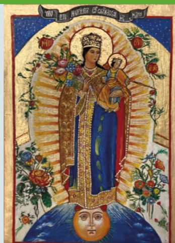
A Nagba öltözött Asszony