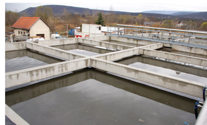
A felújítandó piliscsabai szennyvíztelep

Amikor tavaly elkészítettük a csatornázási terveket, akkor az egyértelműen megmutatkozott, hogy szennyvíztelep-bővítésre van szükség. Ugyancsak az előbb említett csomagnak a részeként elkészítettük a szennyvíztelep bővítésének a tervét is. Ugyanis az az abszurd helyzet áll fenn, hogy az a 2009-ben beadott szennyvíztelep-felújítási pályázat, ami 2015-re lett kész, alig 10%-kal növelte a szennyvíztelep kapacitását, holott a lakosságszám megkétszereződött az elmúlt három évtizedben. Ezért most egy olyan bővítést kell végrehajtanunk, amellyel a telep képes lesz befogadni a még hiányzó egyharmadnyi utca lakossági szennyvi-