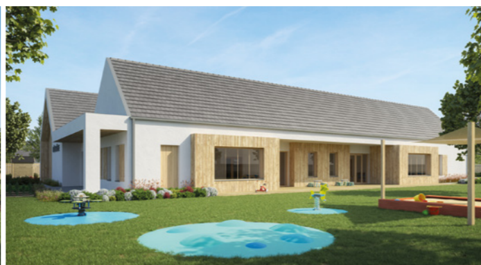
A megpályázott bölcsőde látványterve