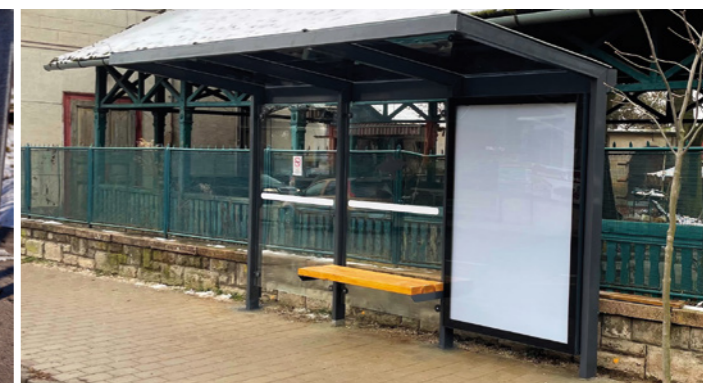
Megújult buszmegálló a vasútállomáson