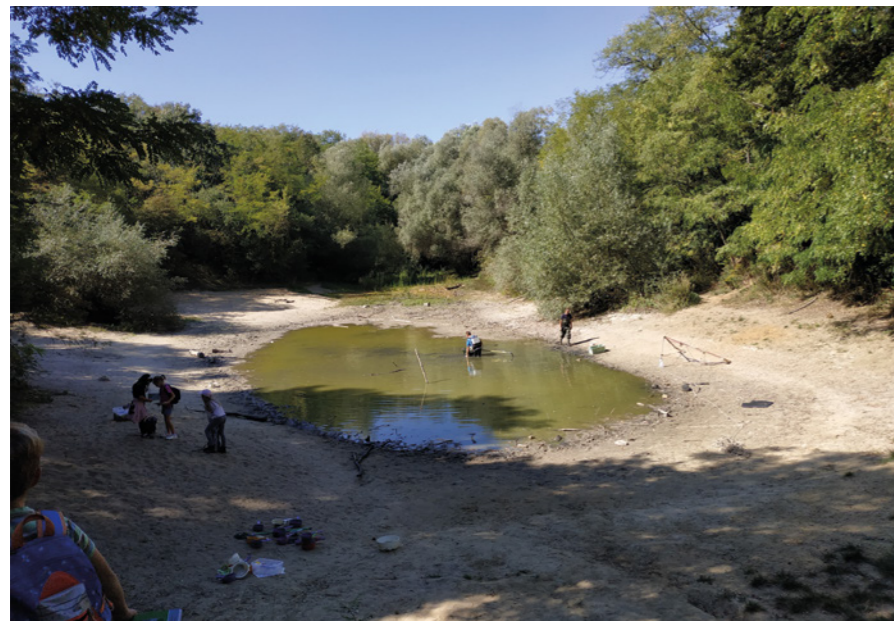
A Jági-tó 2021 szeptemberében

A környékbeli kirándulók kedvenc célpontja – egyben az ott található tanösvény fontos állomása – a pilisszentiváni Jági-tó. Most viszont azt, aki arra jár, szomorú látvány fogadja, hiszen a tómederben szinte egyáltalán nincs víz.