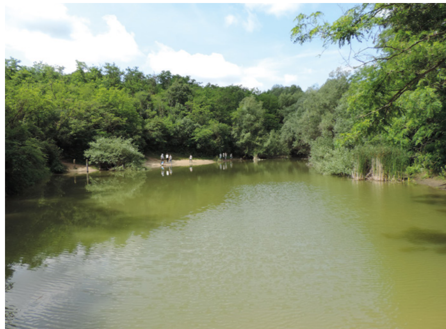
A Jági-tó 2018 júniusában