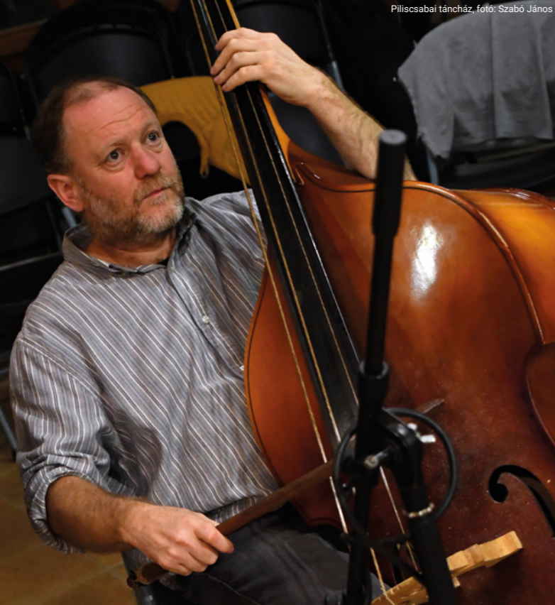
Piliscsabai táncsház

Bejárta a fél világot, miközben zenélt, énekelt és tanított. A mai népzene egyik legismertebb primása. Szerény, mégis nagyon határozott. Csendes, mégis szószátyár. Íme, ez mind Halmos Attila.