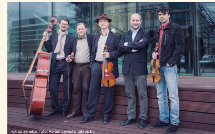
Tükrös zenekar