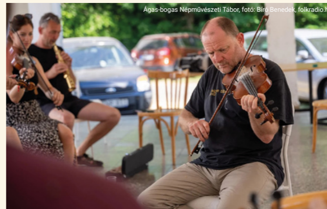
Agas-bogas Népművészeti Tábor, fotó: Bíró Benedek, folkradio.hu

Hegedűn, brácsán, illetve bőgőn, a negyedik pedig fúvós hangszeren játszott. Mindegyik járt zeneiskolába, ott egyikük klasszikust, a másik popzenét tanult. Felnőttként pedig már az ő döntésük volt, hogy merre