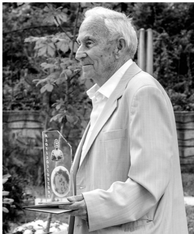
Sándorffy Ottó 2018-ban a Klotildiligetért díjjal

Maga is politikai elítélt lévén, megalakulásától részt vett a Politikai Foglyok Szövetségének munkájában, emellett tagja volt a Magyarok Világszövetségének, fontos volt számára a világban szétszóródott magyarság összefogása, összetartása. Az 1994. évi országgyűlési választásokon mandátumhoz jutott a FKGP Pest megyei listavezetőjeként. Az országgyűlés költségvetési és pénzügyi állandó bizottságában, ezen belül az ellenőrzési és az Európai Unióhoz való csatlakozással foglalkozó albizottságokban dolgozott. Erdemei elismeréseként 1995 őszén megkapta a Hazáért Érdemkeresztet.