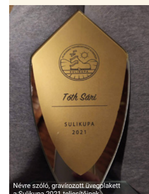
Névre szóló, gravírozott üvegplakett a Sulikupa 2021 teljesítőinek