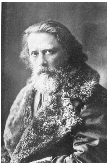
Zichy Mihály fényképe 1881 Bécs

Zichy Mihály a 19. századi magyar képzőművészet kiemelkedő alakja volt. Munkácsy Mihály mellett abban az időben a legismertebb magyar művész Európában. Életének jelentős részét Oroszországban töltötte, négy cárnak az udvari festője volt. Hosszabb ideig élt Franciaországban is, és beutazta egész Európát. Mindvégig kapcsolatban állt Magyarországgal, és magyarságát soha nem adta fel.