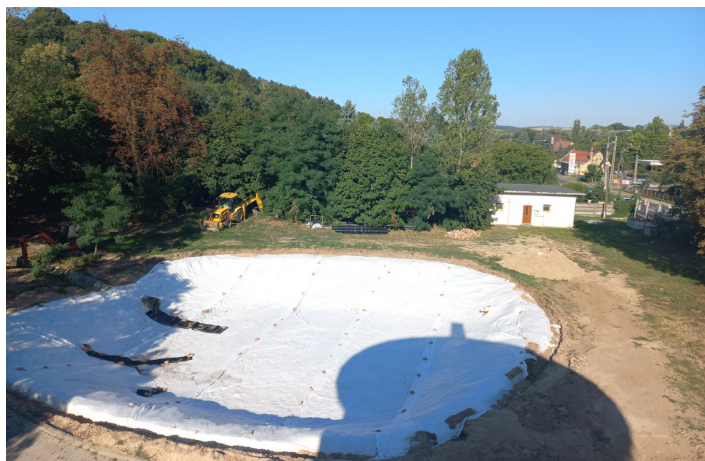
A környezetvédelmi hatóság előírásai szerint felújítják a Iosephinum záportározóját