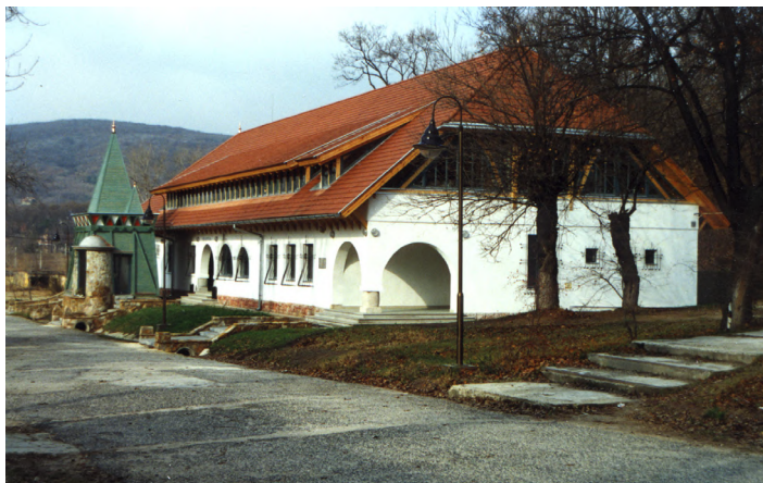
Az 1925-ben épült Quaestura épület eredeti állapotban történt felújítása 1997-ben

A szociológiai vizsgálódások a család és iskola területét vették célba, a közgazdaságiak pedig a mai gazdasági élet