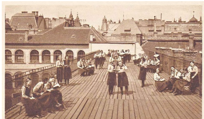
Angolkisasszonyok budapesti B. M. V. intézete, IV. Váci-utca 47. Orakózi szünet a Dunapartra néző tetőtérreazon.