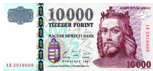
Szent István király arcképe a tízezerforinton

Készítette: Magyar Nemzeti Bank (Hungarian National Bank) – own scan of a banknote 2006 Timur lenk, Hungarian banknote, https://commons.wikimedia.org/w/index.php?curid=982184