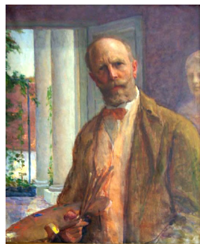
Kunffy Lajos Önarckép

Kunffy Lajos 1869-ben született Orci községben és 1962-ben hunyt el Kaposváron. Budapesten végzett jogi tanulmányokat, és ezzel párhuzamosan iparrajz iskolába is járt.