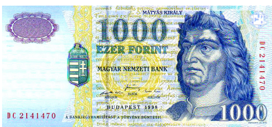
Hunyadi Mátyás arcképe az ezerforinton