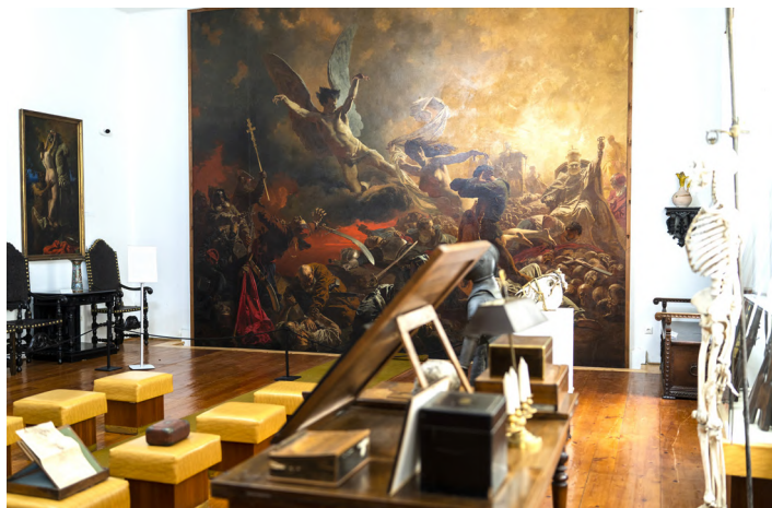
Zichy Mihály Emlékház

Az elkövetkező hónapokra múzeumi látogatásokat ajánlunk. Két festőművész alig-alig emlegetett munkásságát mutatja be a felújított, Somogy megyében lévő emlékházuk.