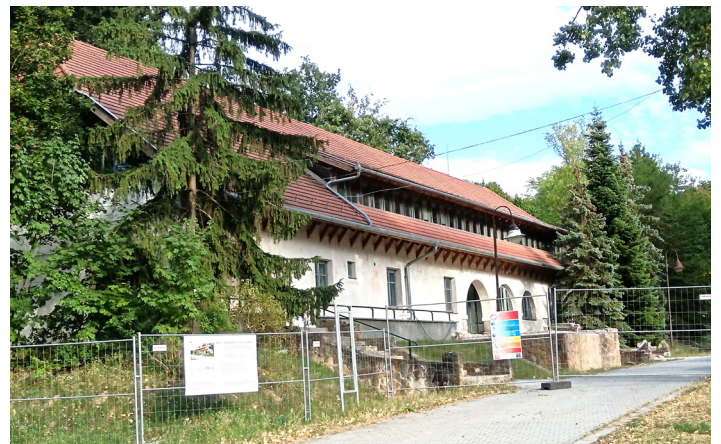
Folyik a Quaestura épület felújítása 2025-ben