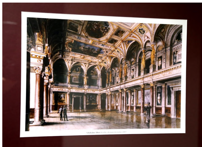
Magyar Tudományos Akadémia dísztermének akvarellje, Schikedanz Albert, 1887.

Készítette: Thaler Tamas - A feltöltő saját munkája, CC BY-SA 4.0, https://commons.wikimedia.org/w/index.php?curid=58874286