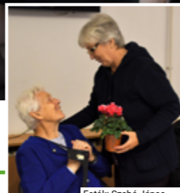
Fotó: Szabó János

November 8-án 17 órakor közmeghallgatást tartunk, ahol az eltelt egy év történéseit és a jövő évre vonatkozó terveinket fogjuk ismertetni. Várunk minden érdeklődőt, hogy minél többen hozzászóljanak. A jövőben az építő kritikát és a jobbító javaslatokat szeretnénk beépíteni a tevékenységünkbe.