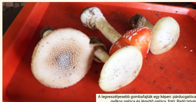
A legveszélyesebb gombafajták egy képen: párducgalóca, gyilkos galóca és légyölő galóca

A mérgezést a gombák által termelt mérgező anyagok, a toxinok okozzák. A gombamérgezésnek fajtól függően különböző tünetei lehetnek. A legenyhébbek a gyomorfájdalom, a súlyos hasmenés és hányás, amit a lilás, illetve sötétlila pókhálógomba, vagy a lila hagymatönkű pókhálás okoz, a legveszélyesebbek pedig a sárgulás, zavarodottság, máj- és veseelégtelenség, amit a gyilkos galócán kívül például a susulykafélék idéznek elő.