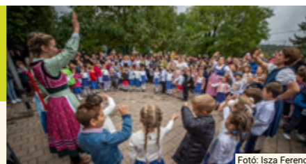
Fotó: Isza Ferenc