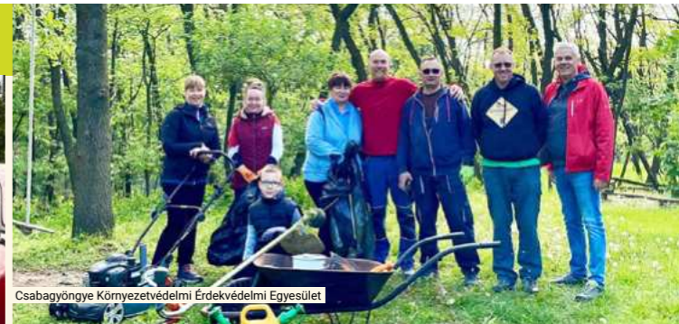
Csabagyöngye Környezetvédelmi Érdekvédelmi Egyesület