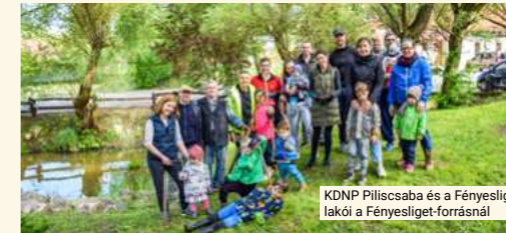
KDNP Piliscsaba és a Fényesliget lakói a Fényesliget-forrásnál