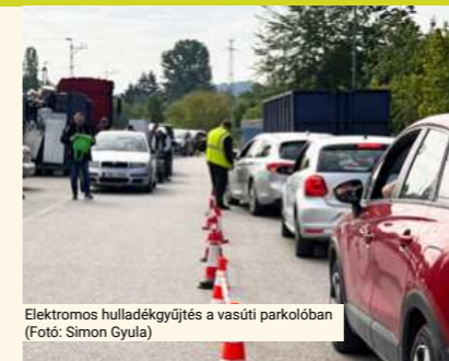
Elektromos hulladékgyűjtés a vasúti parkolóban