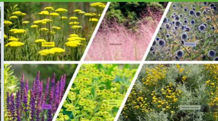
Ezek a növények kevés vízzel is beérik: cickafark, vattacukorfü, echinops, zsálya, hibrid kutyatej, hamvas cipruska

Minden növénynek szüksége van vízre. Ebből hol túl kevés, hol pedig túl sok van. Ha éppen nem esik elegendő eső, öntöznünk kell. Ehhez használhatjuk az ivóvizet, kutat fúrathatunk vagy gyűjthetjük a csapadékokat is. Vegyük sorra a lehetőségeket és nézzük meg, melyik lehet a legjobb megoldás.