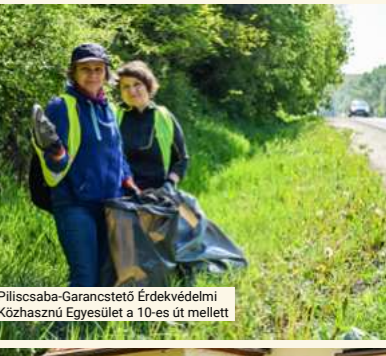
Piliscsaba-Garancstetői Környezetvédelmi Közhasznú Egyesület a 10-es út mellett