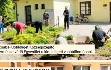
Piliscsaba-Klotildígyet Községépítő és Természetvédő Egyesület a klotildígyeti vasútállomásnál