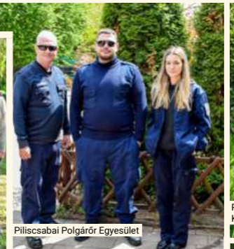
Piliscsabai Polgárőr Egyesület