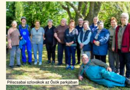
Piliscsabai szlovákok az Ősök parkjában