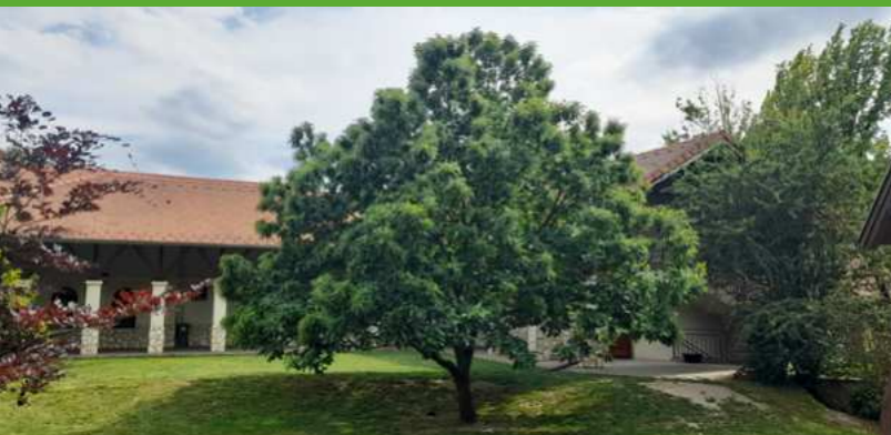
A templom kertjében jól érzi magát a fa, amelynek a tövéhez vezették a csapadékvizet