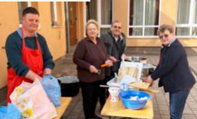
Készül az ebéd a Hauck iskolában