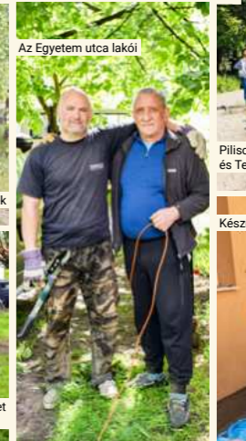
Az Egyetem utca lakói