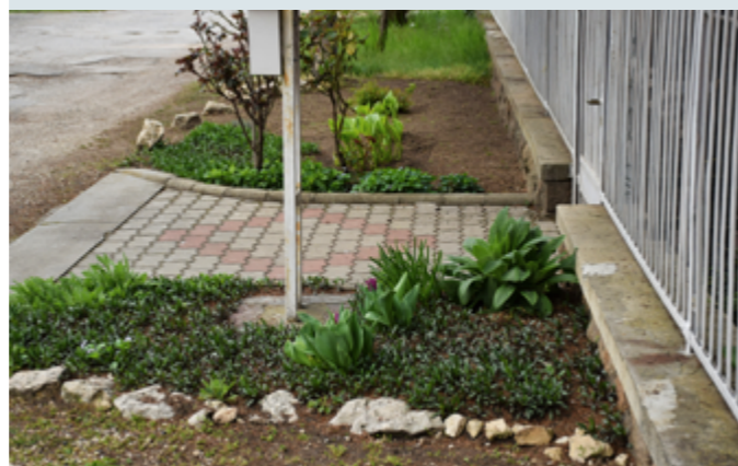
Egy rendezett piliscsabai utcakert (Piliscsabai Polgár, 2023. április)