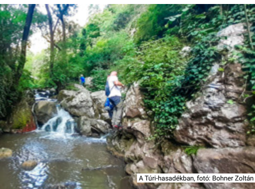
A Türi-hasadékban

Sulikupa túrasorozatunk a nyári hónapokban mindig szünetel. Persze ez nem azt jelenti, hogy otthon lustálkodunk, hiszen ilyenkor előszeretettel túrázunk a környező országokban. Idén nyáron is sikerült több érdekes helyre eljutnunk.