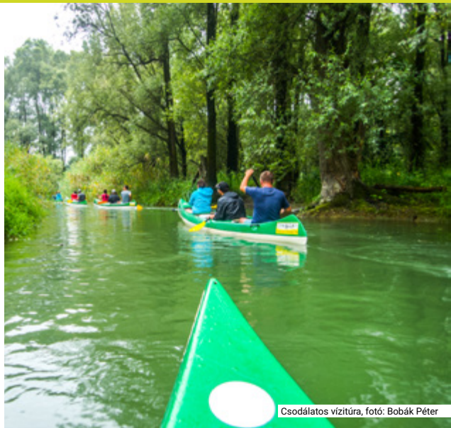
Csodálatos vízitúra, fotó: Bobák Péter

A Piliscsabai Természetjáró Egyesület elnöke