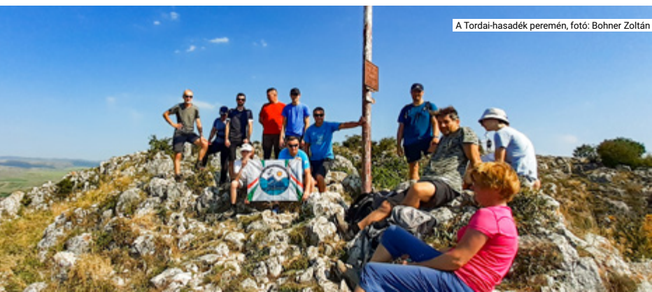
A Tordai-hasadék peremén