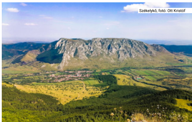
Székelykő, fotó: Ott Kristóf