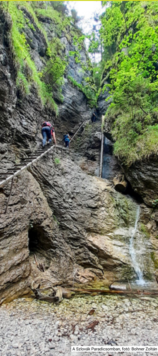
A Szlovák Paradicsomban