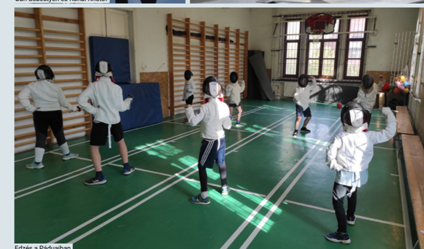
Edzés a Páduaiban