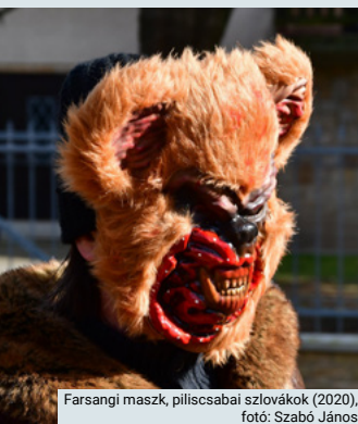
Farsangi maszk, piliscsabai szlovákok (2020), fotó: Szabó János

Hamvazószerdán azonban el kellett temetni a farsangot. Erre az alkalomra szintén beöltöztek a fiúk és lovas kocsin mentek végig a falun. A kocsin koporsóban feküdt a farsang, ami nem volt más, mint egy forrázó teknőbe fektetett szalmabáb. Miután a falusi körúton megsírták a farsang halálát, a kocsi betért a törzsvendéglőbe, ahol az udvaron nagy jajveszékelés és siránkozás közepette elégették és elásták a bábút. Egy másik farsangi szokás a 18 éves fiúkat érintette. Ekkor »felavatták« magukat, hogy ezentúl az ifjak közösségének teljes értékű tagjai lehessenek. Ez a következőképpen zajlott: a táncos rendezvény alatt felsorakoztak a jelöltek a zenekar előtt. Miután a beavatási bizottság által meghatározott fejenkénti 5 liter bort kifizették, egy kézfogással tagjai lettek a legénykörnek. Amikor a zene elkezdődött, a felavatott ifjúknak gyorsan meg kellett innia a pohár borát, és a pódium előtt álló lányok körébe kellett ugrania s egyet felkérni táncolni. Ha a jelölt nem volt elég gyors, a bizottság egy-egy poffonnal vagy rúgással szívesen a segítségére sietett.”