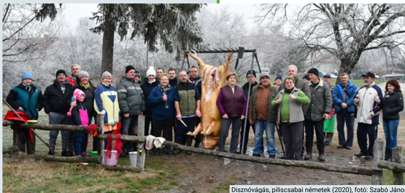
Disznóvágás, piliscsabai németek (2020), fotó: Szabó János