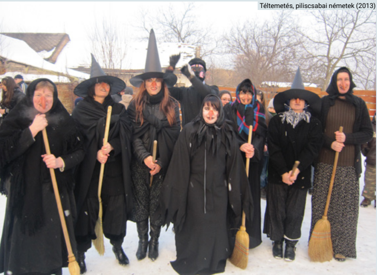
Tétemetés, piliscsabai németek (2013)