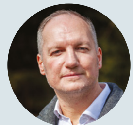
■ Piliscsabai Polgár

Feltételes közbeszerzést írtunk ki továbbá a szennyvíztelep bővítésére, erre beérkeztek az ajánlatok. Ez a beruházás feltétlenül szükséges ahhoz, hogy a csatornahálózat további bővítése megindulhasson. Úgy néz ki, a nagyságrendileg 300 millió forintos építkezéshez most jó eséllyel folyamodunk állami támogatásért. Ha minden jól megy, akár ez a beruházás is elkészülhet idén. Ezen felül csatornahálózat-, út- és járdaépítést is szeretnénk megvalósítani ebben az esztendőben a település több pontján. Bizakodó vagyok.