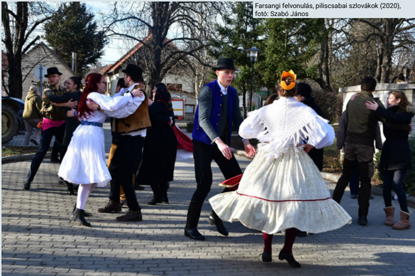
Farsangi felvonulás, piliscsabai szlovákok (2020), fotó: Szabó János